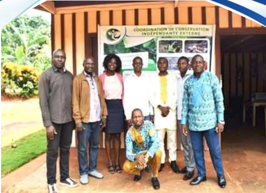
Le CADDE aux réunions ordinaire et extraordinaire de la C-OIE./ © CADDE