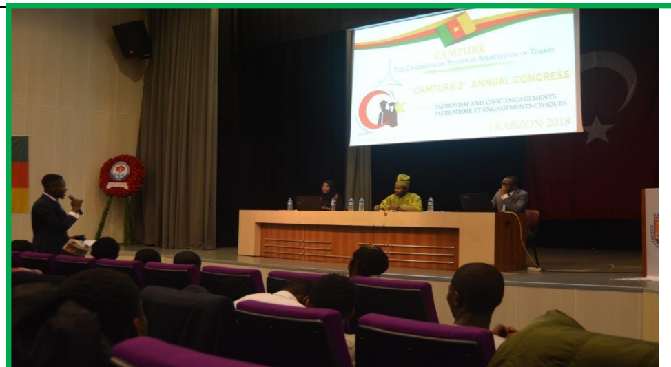
Circonsance des conférences et échanges avec les participants