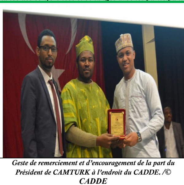
Geste de remerciement et d'encouragement de la part du Président de CAMTURK à l'endroit du CADDE.