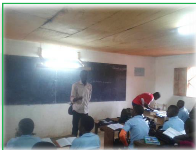
La sensibilisation des élèves de la classe de Terminale au Collège les Béatitudes./ © CADDE.

En somme, 03 thèmes ont été abordés dans 04 établissements secondaires pour environ 6000 élèves sensibilisés.