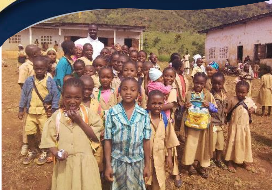
Le CADDE auprès des tous petits de l'Ecole Publique de Didango.