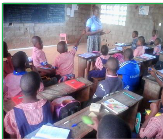
Classe de CM1 au GSB les Oisillons

Des photos de la sensibilisation dans les écoles primaires.