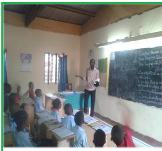
Classe du CM2 au GSB les Béatitudes

Ainsi, 02 thèmes ont été abordés dans 03 établissements ; 200 élèves environ ont été sensibilisés.