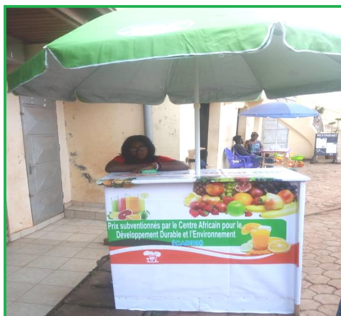
Cocktail bio : une solution pour une consommation verte et pour les problèmes de santé liés à la consommation des aliments à fortes doses chimiques.

« Cocktail bio » est un projet de production et de commercialisation de jus de fruits naturels. Notre principale vision est de vulgariser la consommation des jus de fruit naturels au Cameroun dans l'optique d'améliorer les conditions de vie des populations. C'est un projet qui rentre en droite ligne avec l'un des objectifs spécifiques du Centre, à savoir : « Appuyer les communautés locales dans la création des activités génératrices des revenus ». Le projet « Cocktail bio » est parti du constat selon lequel plusieurs personnes manifestent souvent une certaine réticence vis-à-vis des boissons industrielles gazeuses, contenant des produits chimiques qui sont très nuisibles à la santé. La première question qui nous est venue à l'esprit était celle de savoir comment faire pour juguler ce problème en proposant sur la table de consommation une boisson naturelle faite à base des fruits naturels sans conservateurs chimiques. La solution a été vite trouvée à travers la mise sur pieds du projet « Cocktail bio ». Et c'est cette solution durable que nous leur apportons en leur proposant des jus naturels frais sans additifs artificiels.