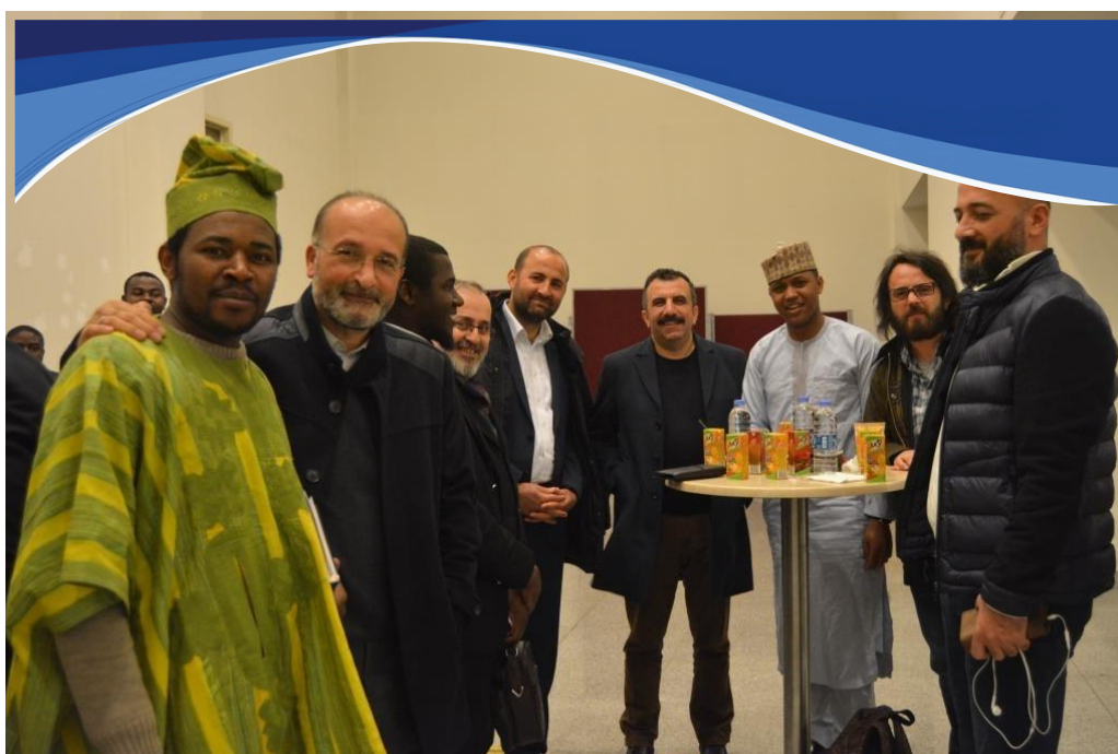
Le CCRI/CADDE (premier plan à gauche), en osmose parfaite avec des citoyens Turcs et des ressortissants de la diaspora camerounaise en Turquie.

C'est à une vaste campagne de partage de la vision, des valeurs, des acquis et des informations consolidées par le CADDE au niveau régional, national et local, avec la diaspora camerounaise installée en Turquie. Le dynamisme du CADDE lui a valu très rapidement les témoignages de reconnaissance des efforts fournis en Turquie par la CAMTURK lors de son 3 ème Congrès International des Étudiants Camerounais en Turquie tenu à Trabzon du 01 er au 05 Février 2018.