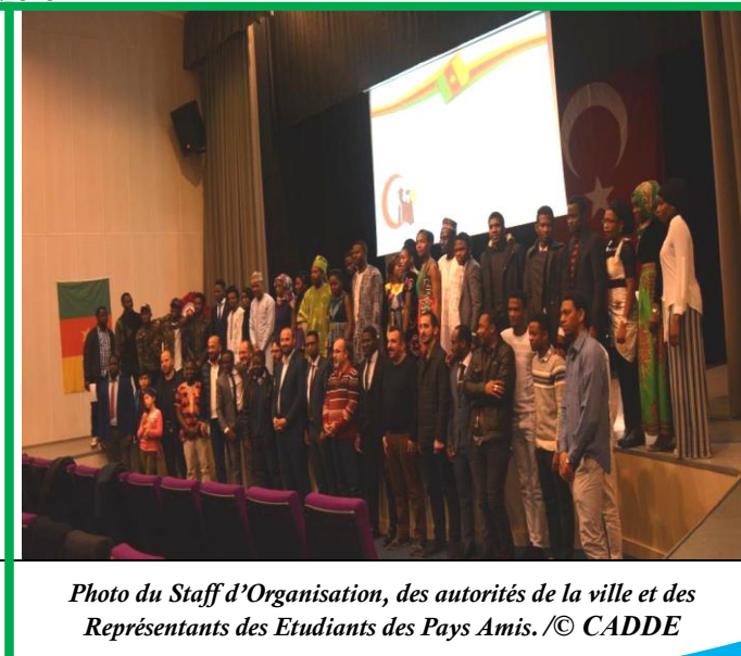
Photo du Staff d'Organisation, des autorités de la ville et des Représentants des Etudiants des Pays Amis.